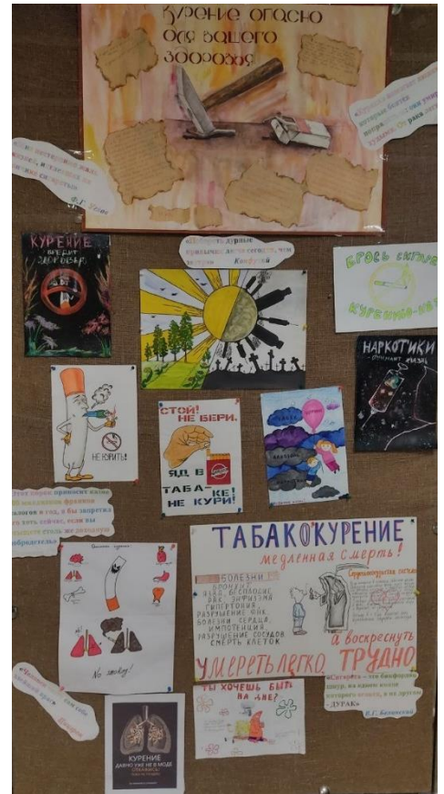
Денис Рябцев, уч-ся группы 28X1

В рамках Недели профилактики никотиновой зависимости в колледже прошла акция « Меняю сигарету на конфету », был подготовлен тематический стенд с плакатами и рисунками учащихся по теме.