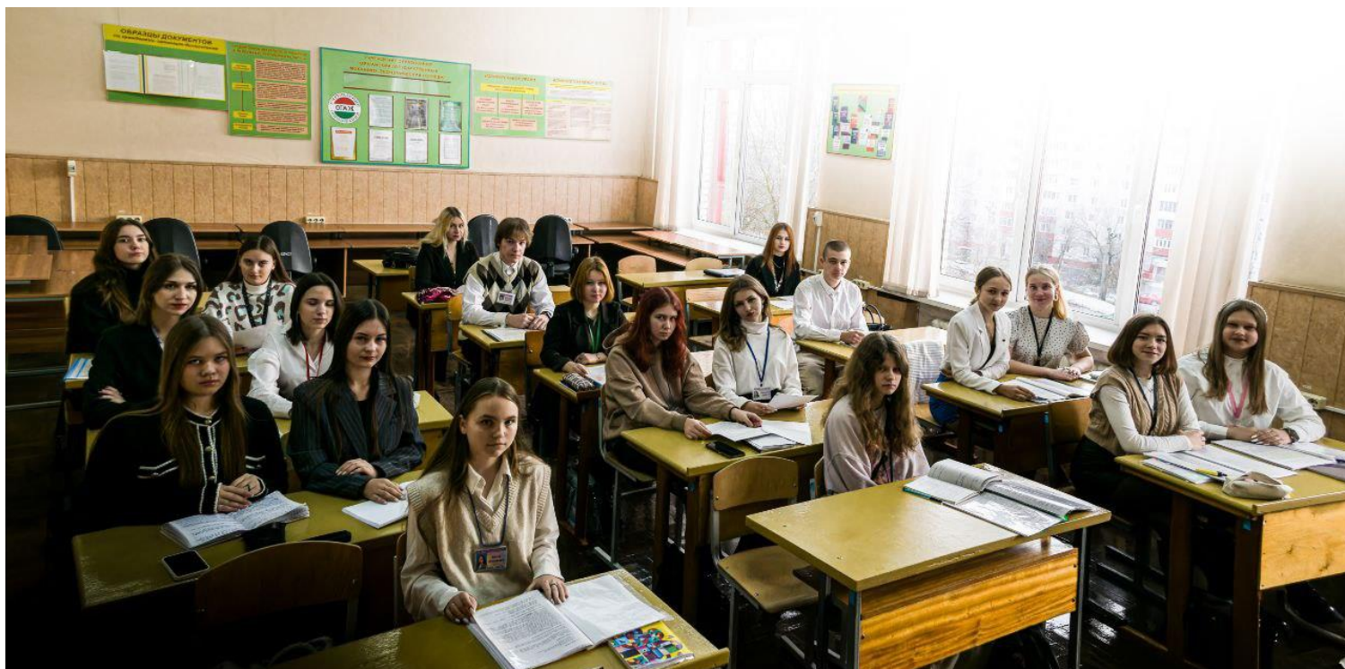
Группа 21 к.