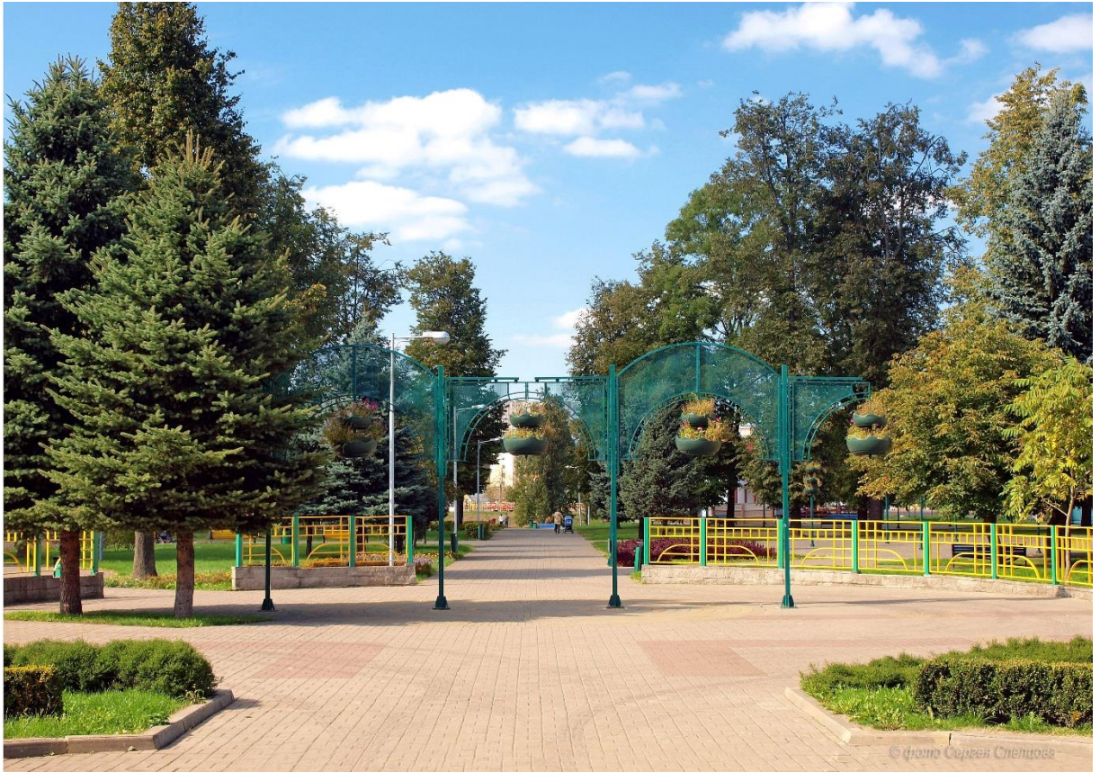
У гарадскім парку.

150 год з часу закладкі ў Оршы гарадскога парка (1873).