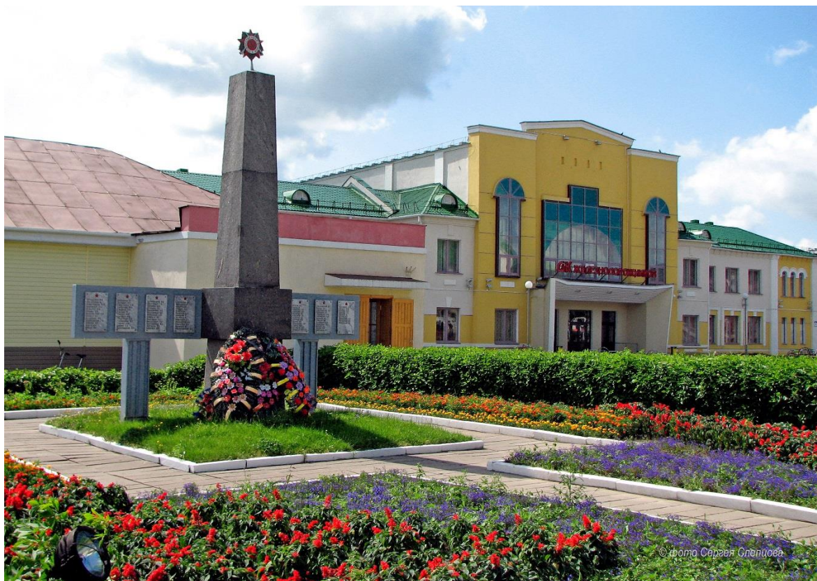
Будынак музея (да 2006 г.).

75 год з часу адкрыцця ў Оршы Мемарыяльнага музея Героя Савецкага Саюза К.С. Заслонава (1948).