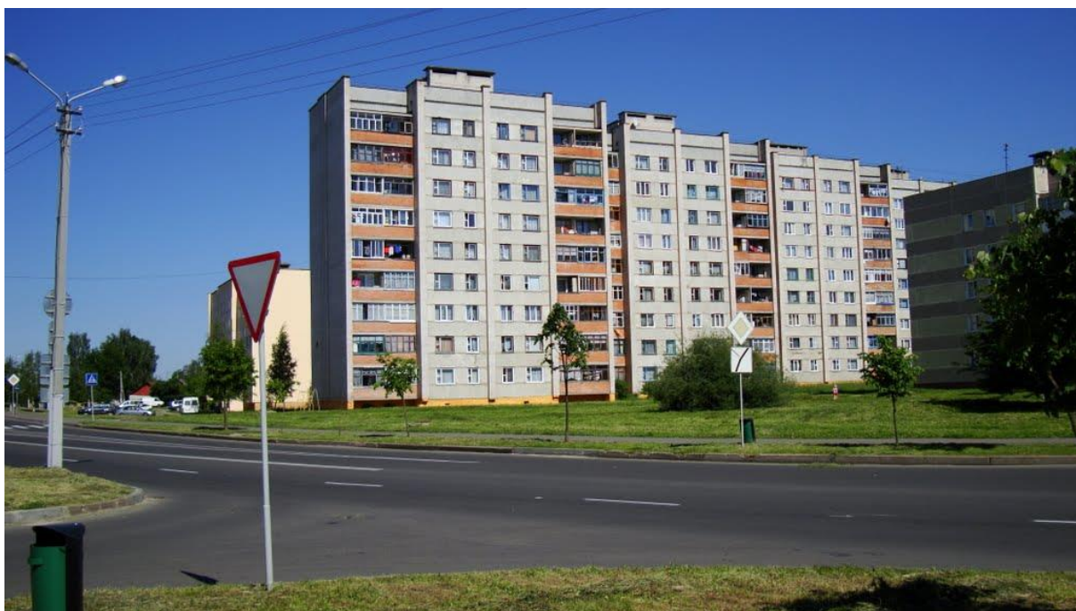
Вуліца Воз-ан-Влен у Оршы.

50 год з часу ўстанаўлення пабрацімскіх сувязей паміж Оршай і французскім горадам Воз-ан-Вленам (1973).